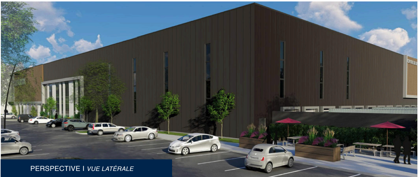
PERSPECTIVE | VUE LATÉRALE