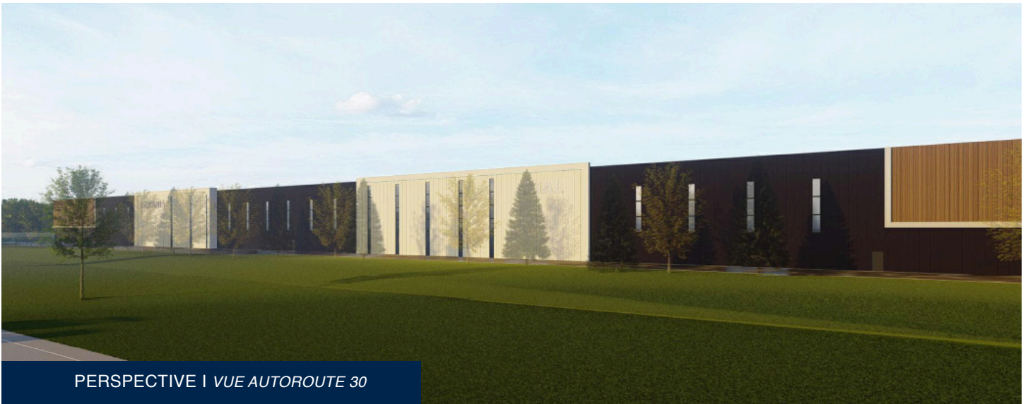
PERSPECTIVE | VUE AUTOROUTE 30