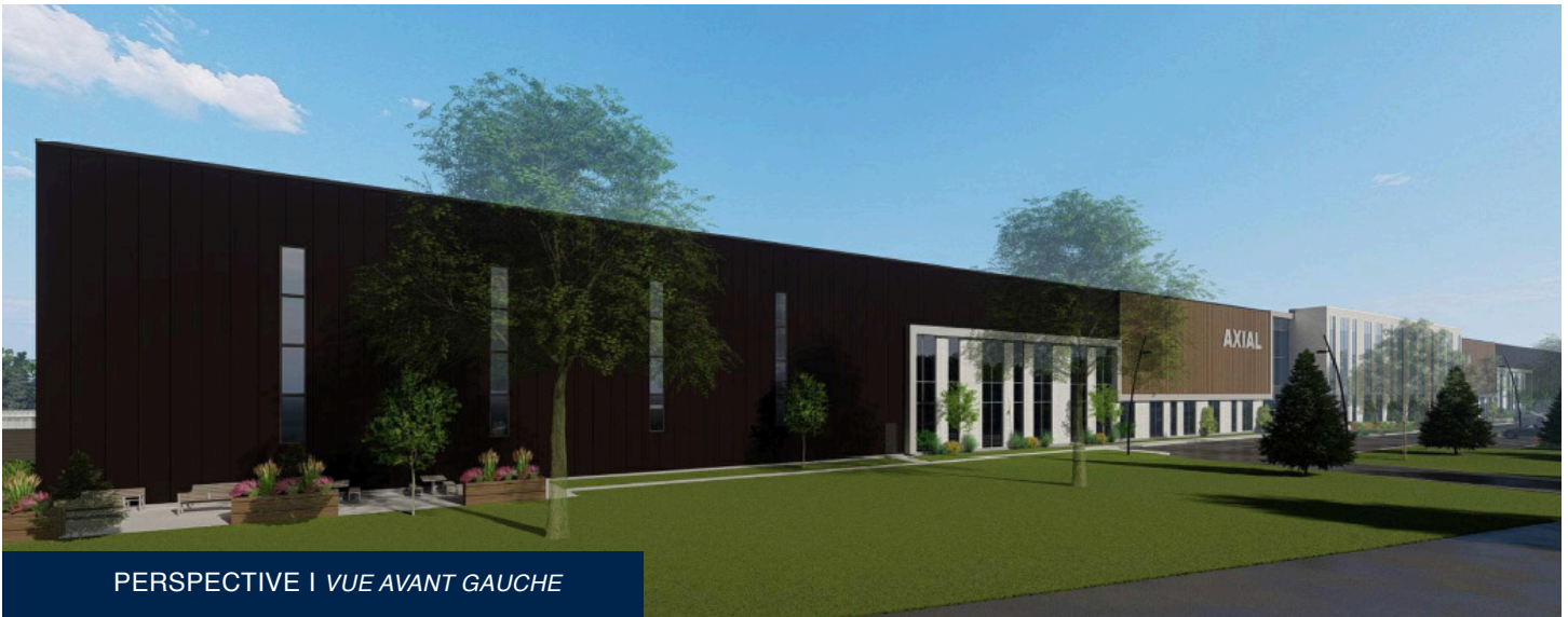
PERSPECTIVE | VUE AVANT GAUCHE