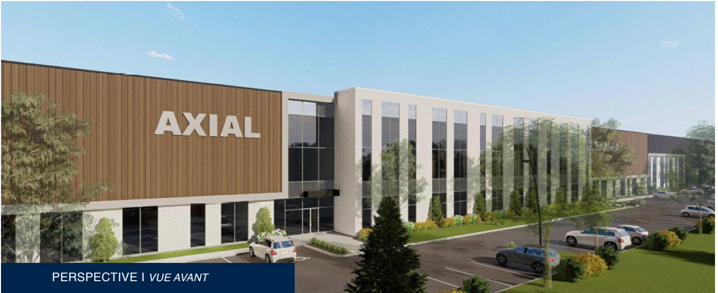
PERSPECTIVE | VUE AVANT