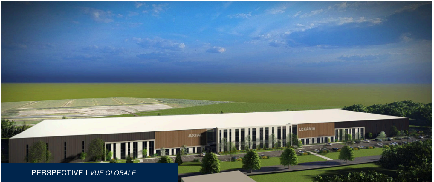
PERSPECTIVE | VUE GLOBALE