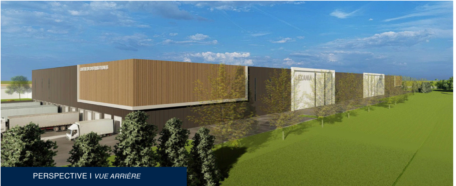
PERSPECTIVE | VUE ARRIÈRE