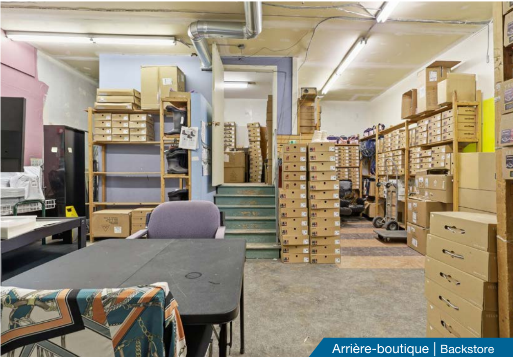
Arrière-boutique | Backstore