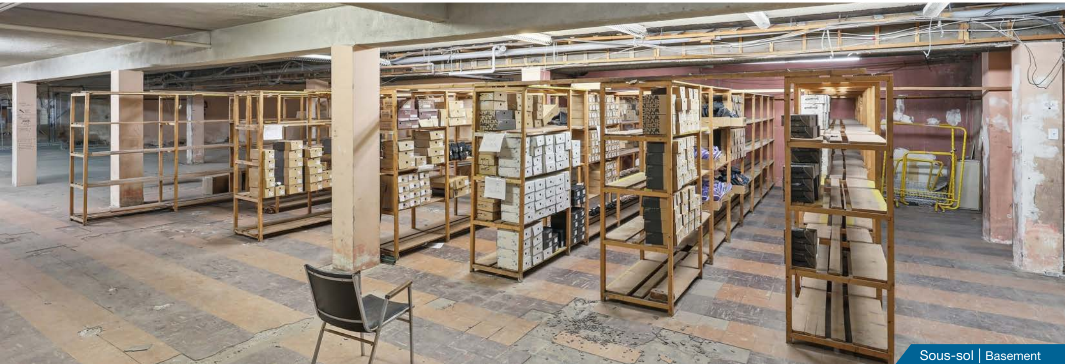
Sous-sol | Basement