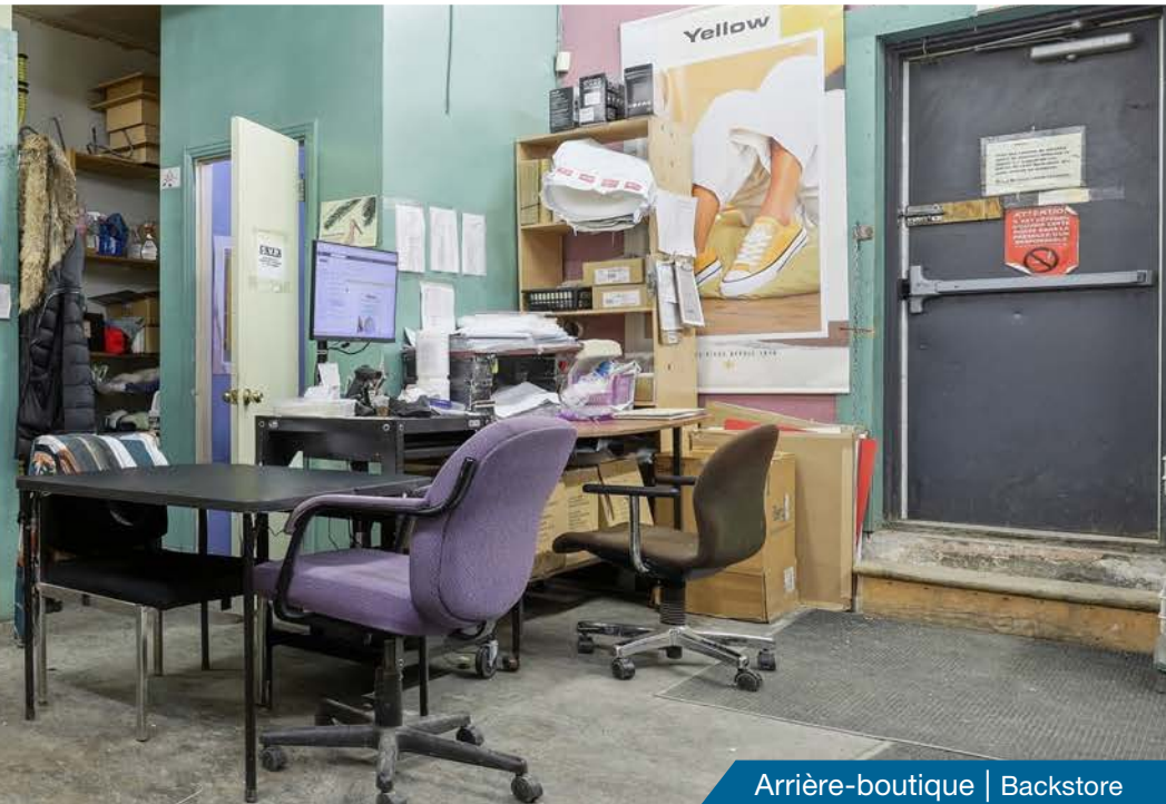
Arrière-boutique | Backstore