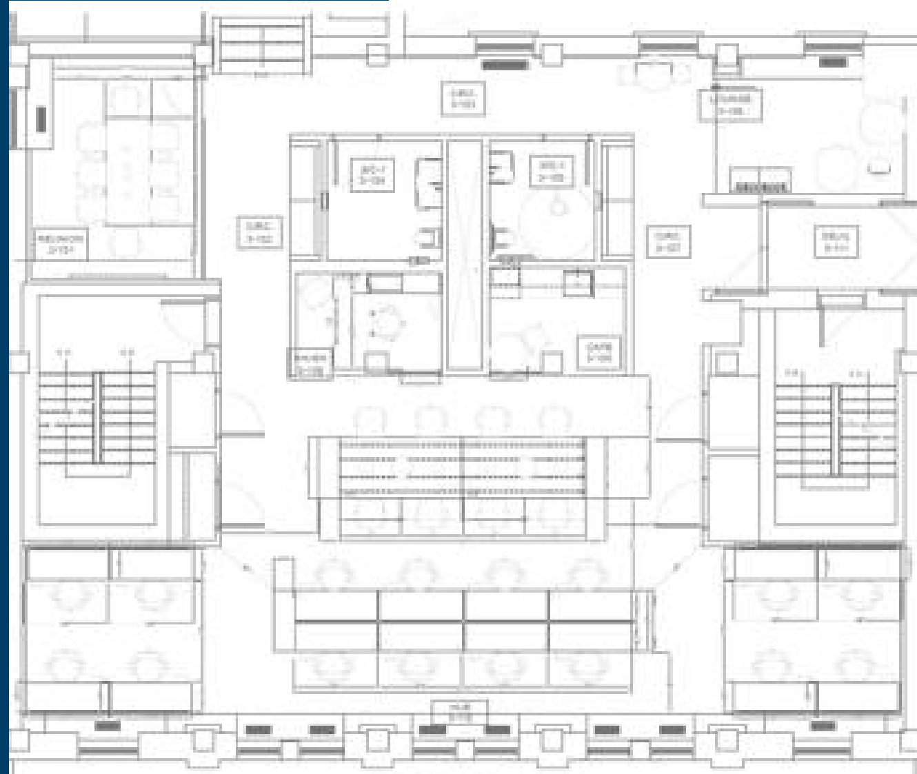
3 E ÉTAGE 3 RD FLOOR