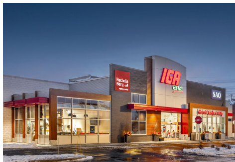
IGA Extra Marché Contrecœur