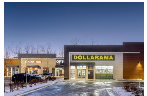
Chico - Opto Réseau - Dollarama