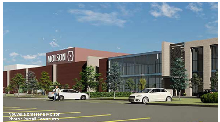
Nouvelle brasserie Molson

Bâtiment neuf au cœur du secteur de l'Aéroport de Saint-Hubert, qui profite actuellement d'une solide croissance