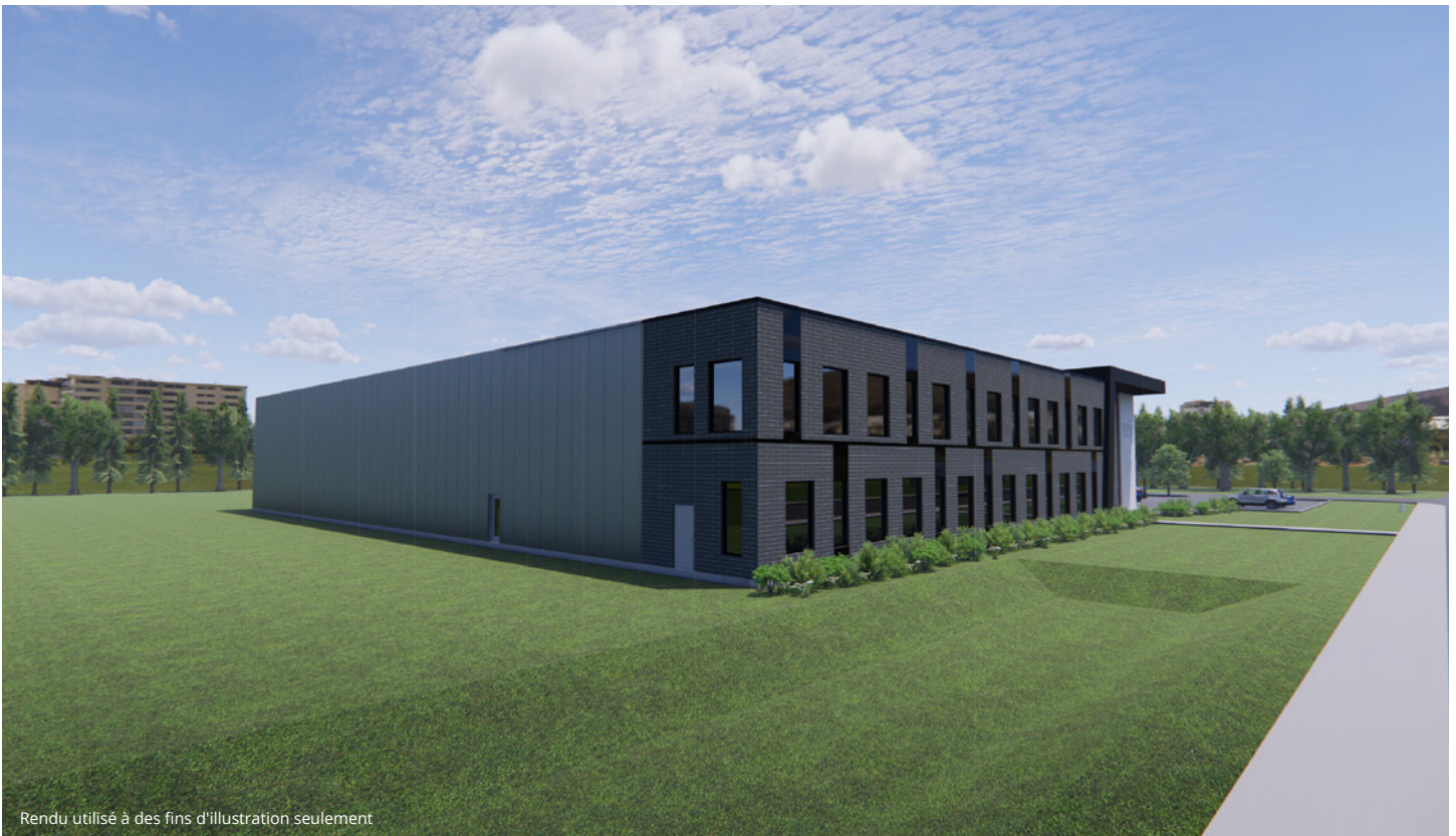
Rendu utilisé à des fins d'illustration seulement