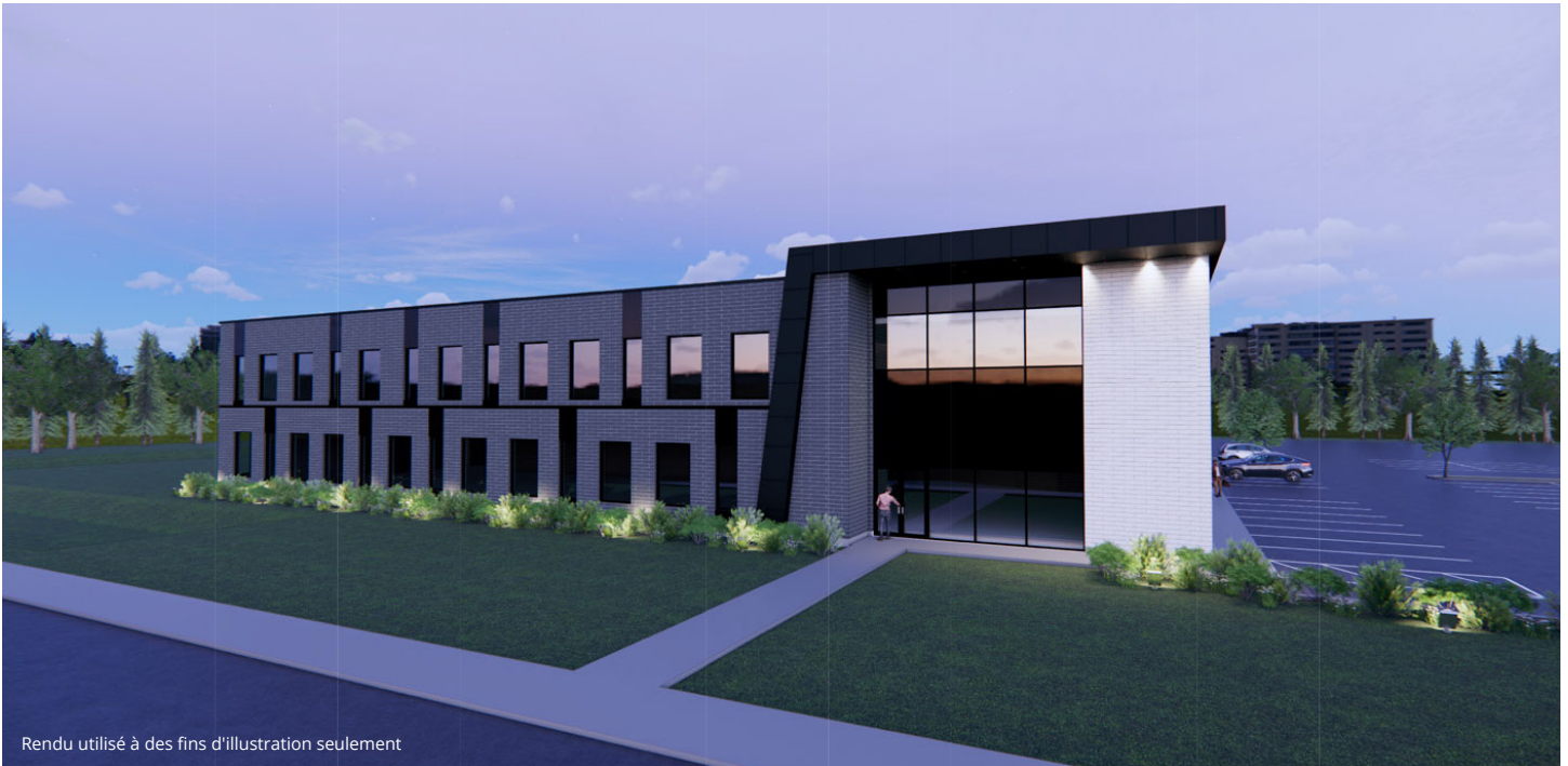
Rendu utilisé à des fins d'illustration seulement