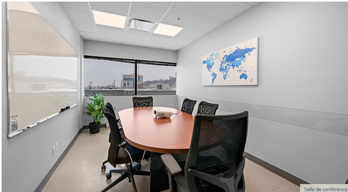
Salle de conférence