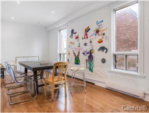
Salle de conférence