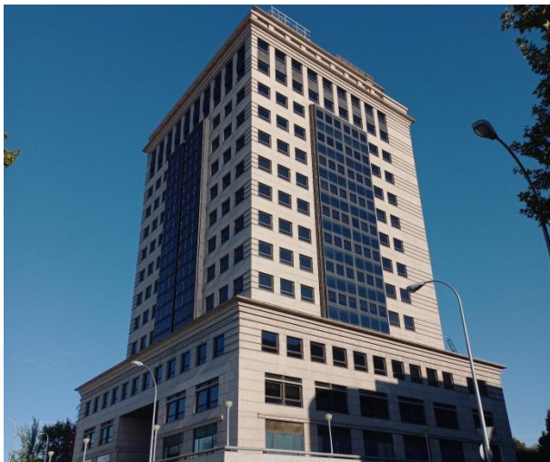
Oficinas en alquiler