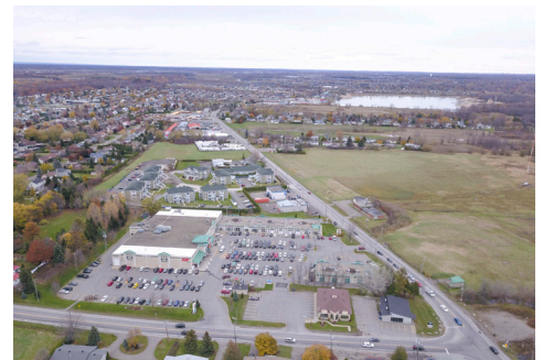
Vue aérienne - Aerial view