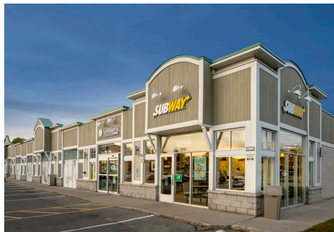
Subway, Famiprix, Ongles & Spa Kadie, SAQ