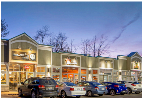
Sushi shop, Boutique Table top