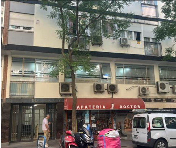
Oficinas en alquiler