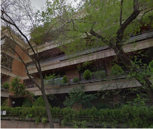
Oficinas en venta