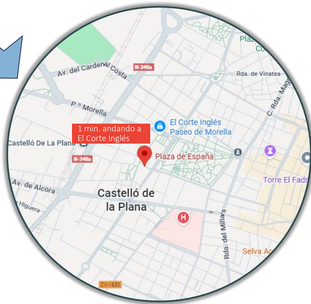
Plaza de España, Castellón