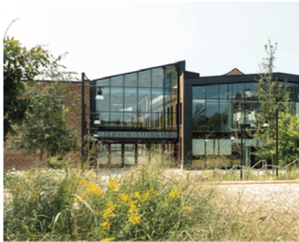
Block 2 - 3 west of Place de l'Île-Philemon

Blocks 2 & 3 are former industrial buildings, beautifully rehabilitated and repurposed into unique retail and office space. Located to the east of Eddy Street in Gatineau, and to the west of the welcoming Place de l'Île-Philemon, the brick and beam structures of Blocks 2 and 3 are joined by a striking glass atrium. Nearby Public Works campuses, the residential "O" building, engaging outdoor spaces, and previously inaccessible waterfront, make Blocks 2 & 3 a dynamic setting for ground-floor retail tenants.