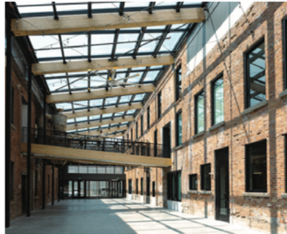
Glass atrium joining Block 2 - 3