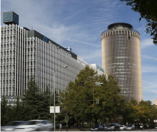
Oficinas en alquiler