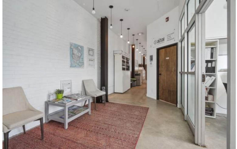
Face au Parc Jarry